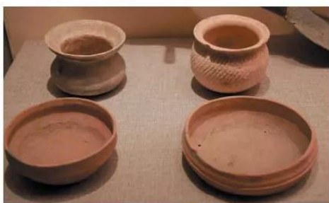
15.2 Đồ gốm thuộc văn hoá Đông Sơn

Các nghề thủ công như làm đồ gốm, dệt vải, làm nhà, đóng thuyền phát triển. Nghề luyện kim phát triển cao, nhiều người chỉ chuyên làm nghề đúc đồng, rèn sắt. Những hoa văn tinh xảo trên trống đồng Ngọc Lũ, thạp đồng Đào Thịnh là minh chứng cho trình độ kỹ thuật và mỹ thuật của người thợ thủ công Văn Lang, Âu Lạc.