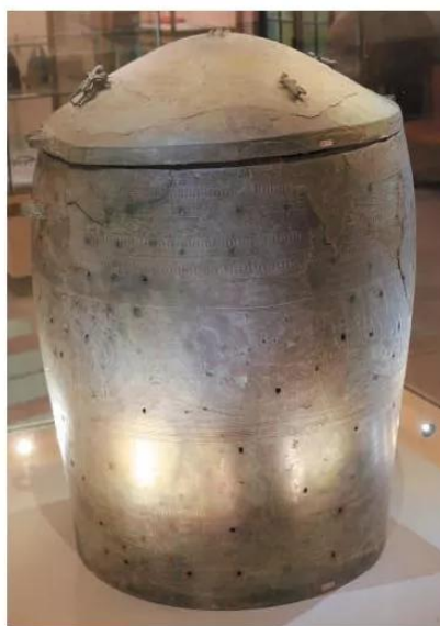
15.3 Thạp đồng Đào Thịnh