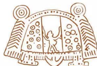
15.7 Hình vẽ mô phỏng nhà sàn của cư dân Văn Lang, Âu Lạc dựa trên hoa văn của trống đồng Ngọc Lũ.