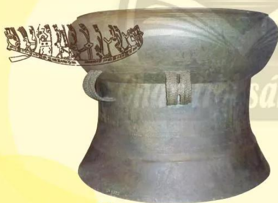
15.4 Trống đồng Ngọc Lũ

Trống đồng được tìm thấy ở nhiều nơi trên đất nước Việt Nam, minh chứng cho nền văn minh của người Việt cổ. Một trong những chiếc trống có hoa văn phong phú nhất là trống đồng Ngọc Lũ, được phát hiện năm 1893 ở xã Như Trác, huyện Nam Xang (nay là huyện Lý Nhân, tỉnh Hà Nam).