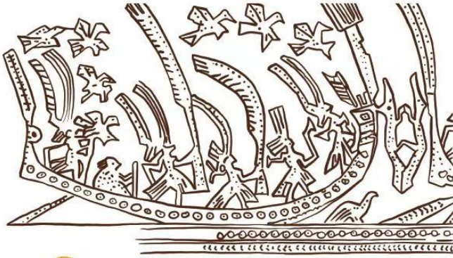
15.9 Nhảy múa trên thuyền – Hình phục dựng dựa trên hoa văn của thạp đồng Đào Thịnh