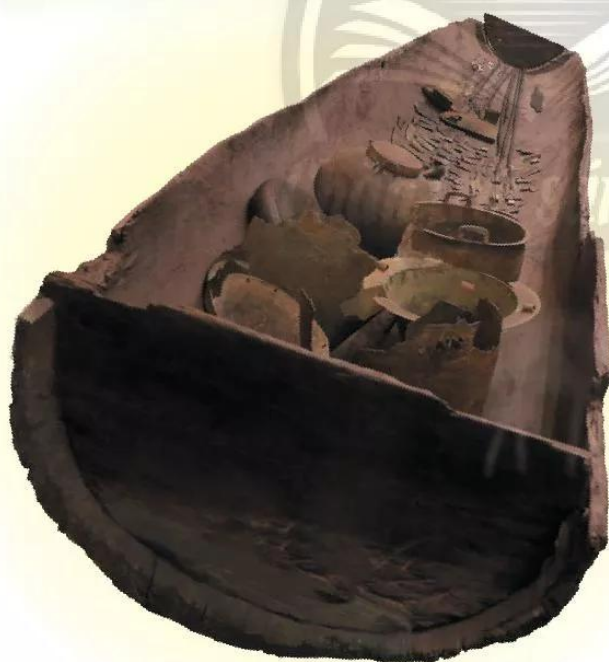
15.8 Mộ thuyền Việt Khê, khoảng thế kỉ VTCN Được tìm thấy ở Phù Ninh, Thủy Nguyên, Hải Phòng, bên trong chứa 107 đồ tùy táng, gồm nhiều công cụ lao động.

Dựa vào tư liệu 15.8, 15.9 và thông tin trong bài học, em hãy cho biết những điểm nổi bật trong đời sống tinh thần của cư dân Văn Lang, Âu Lạc.