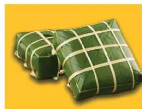
15.6 Bánh chưng