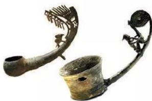
15.5 Muôi đồng Đông Sơn

Thức ăn chính là cơm nếp, cơm tẻ, ăn cùng với rau, cua, tôm, cá, ốc... Ngày lễ, ngày tết có thêm bánh chưng, bánh giầy. Cư dân Văn Lang, Âu Lạc đã biết làm mắm cá, làm muối, dùng gia vị, biết sử dụng mâm, bát, muối,... có trang trí hoa văn đẹp.