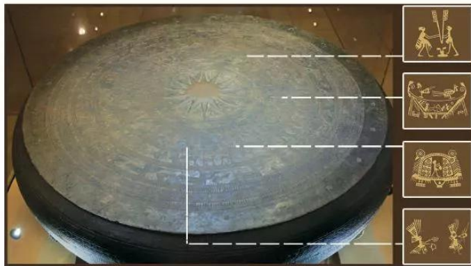
15.1 Mặt trống đồng Ngọc Lũ (Bảo tàng Lịch sử Quốc gia)