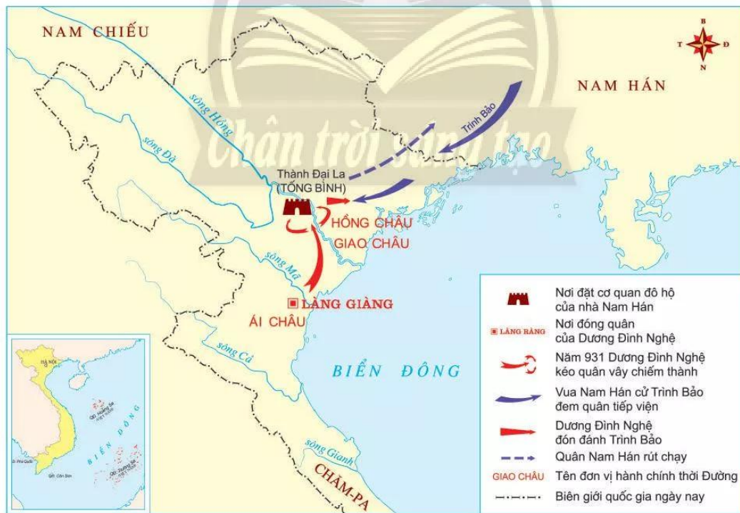
19.2 Lược đồ chống quân Nam Hán lần thứ nhất

Sau khi đánh tan quân Nam Hán, Dương Đình Nghệ tự xưng là Tiết độ sứ, khôi phục nền tự chủ.