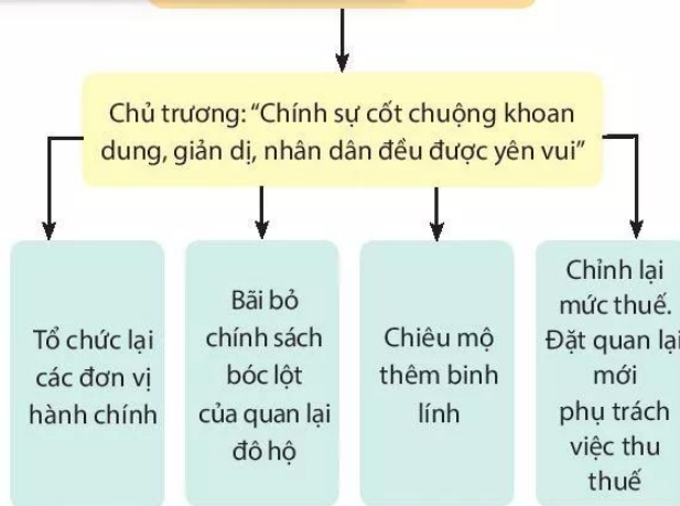
19.1 Những chính sách cải cách của Khúc Hạo