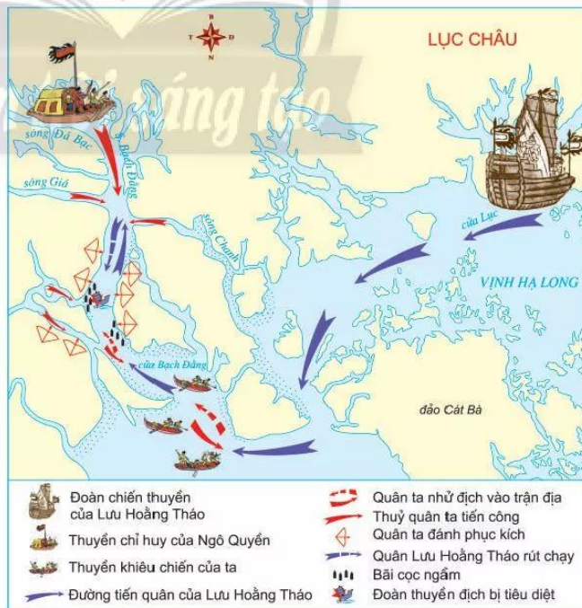
19.4 Lược đồ trận Bạch Đằng năm 938

(Đại Việt sử kí toàn thư, tập I, NXB Khoa học xã hội, Hà Nội, 1998, tr. 203)