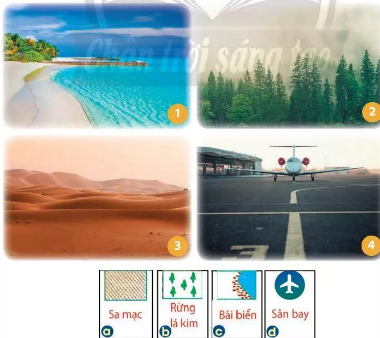
Hình 2.1. Một số đối tượng địa lí và kí hiệu quy ước của chúng trên bản đồ

Kí hiệu bản đồ giúp người đọc phân biệt được sự khác nhau của các thông tin thể hiện trên bản đồ. Ý nghĩa của các kí hiệu được giải thích rõ ràng trong chú giải của bản đồ.