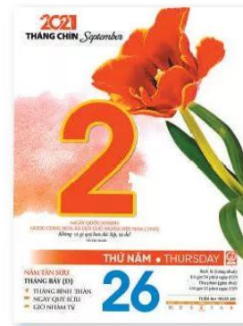
2.3 Tờ lịch

Lịch chính thức của thế giới hiện nay dựa theo cách tính thời gian của dương lịch, gọi là Công lịch. Công lịch lấy năm 1 là năm tương truyền Chúa Giê-su (Jesus, người sáng lập đạo Thiên chúa) ra đời làm năm đầu tiên của Công nguyên. Trước năm đó là trước Công nguyên (TCN). Từ năm 1 trở đi, thời gian được tính là Công nguyên (CN).