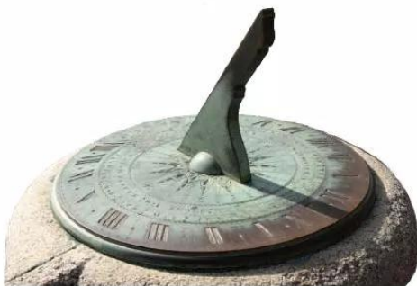
2.2 Đồng hồ mặt trời