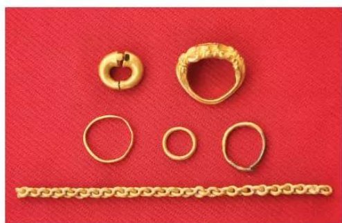
21.6 Một số sản phẩm kim hoàn của Phù Nam (Di chỉ Gò Tháp, tỉnh Đồng Tháp)

Bên cạnh một nền nghệ thuật kim hoàn tinh tế, phát triển cao, Phù Nam còn nổi tiếng với những bức chạm nổi trên đá, đất nung.