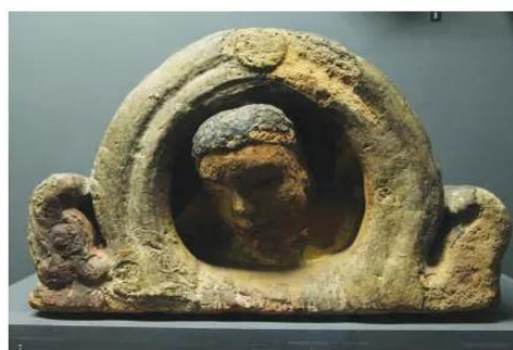
21.7 Phù điêu chạm mặt người, cao 31,5 cm, phát hiện ở Núi Sam, Châu Đốc