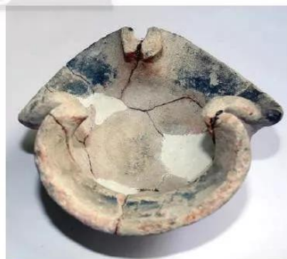
21.4 Hiện vật cà ràng trong văn hoá Óc Eo

Người Phù Nam đun nước trong những chiếc ấm vòi cổ ngỗng và nấu thức ăn bằng nồi gốm đặt trên cà ràng. Cà ràng là loại lò đất có đáy giữ tro, có thể đun bằng củi hoặc than rất thuận tiện khi ở trên nhà sàn hay di chuyển trên ghe, thuyền. Ngày nay, cà ràng vẫn được sử dụng khá phổ biến ở vùng nông thôn Tây Nam Bộ.