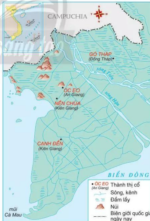
21.1 Lược đồ một số thành thị cổ của Phù Nam

Khảo cổ học đã phát hiện những dấu tích của một hệ thống các thành thị cổ Phù Nam ở vùng Đồng bằng sông Cửu Long. Nổi bật trong đó là Ốc Eo ở An Giang; Nền Chùa và Cạnh Đền ở Kiên Giang; Gò Tháp ở Đồng Tháp. Các thành thị này được xây dựng trên bờ kênh ngập nước 5 đến 6 tháng mỗi năm, chỉ cách biển từ 2 km đến 10 km và nối với nhau bằng những con kênh.