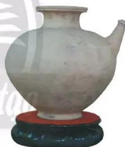
21.2 Bình gốm thế kỉ IV-VI (Bảo tàng Lịch sử Thành phố Hồ Chí Minh)

Người Phù Nam còn rất giỏi buôn bán. Họ mở cửa giao lưu thương mại, trao đổi sản vật và hàng hoá với thương nhân các nước như Ấn Độ, Trung Quốc, Ả Rập, Mã Lai,... Hoạt động buôn bán nhộn nhịp ở các cảng thị, đặc biệt ở Óc Eo.