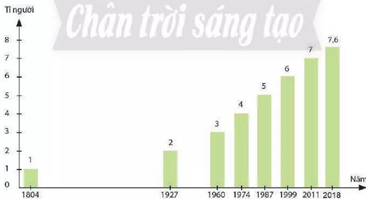
Hình 22.1. Quy mô dân số thế giới qua các năm

Năm 1804, lần đầu tiên dân số thế giới đạt quy mô 1 tỉ người. Năm 2018, dân số thế giới đạt 7,6 tỉ người. Dân số luôn biến động và tình hình gia tăng dân số có sự khác nhau giữa các quốc gia. Nhiều nước dân số tăng nhanh, ngược lại, một số nước dân số tăng rất chậm hoặc giảm. Trên quy mô toàn thế giới, dân số có xu hướng tiếp tục tăng.