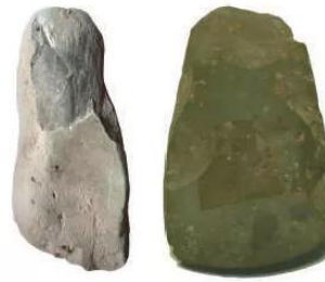
4.6 Bàn mài và rìu mài lưỡi (văn hoá Bắc Sơn) khoảng 11 000 năm tuổi

Nhờ cải tiến công cụ lao động, đôi bàn tay dần trở nên khéo léo hơn, cơ thể cũng dần biến đổi để thích ứng với các tư thế lao động. Con người đã từng bước tự cải biến và hoàn thiện mình.