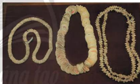
4.12 Chuỗi hạt vỏ ốc, xóm Thẩm (Quảng Bình) cách ngày nay khoảng 4000 năm