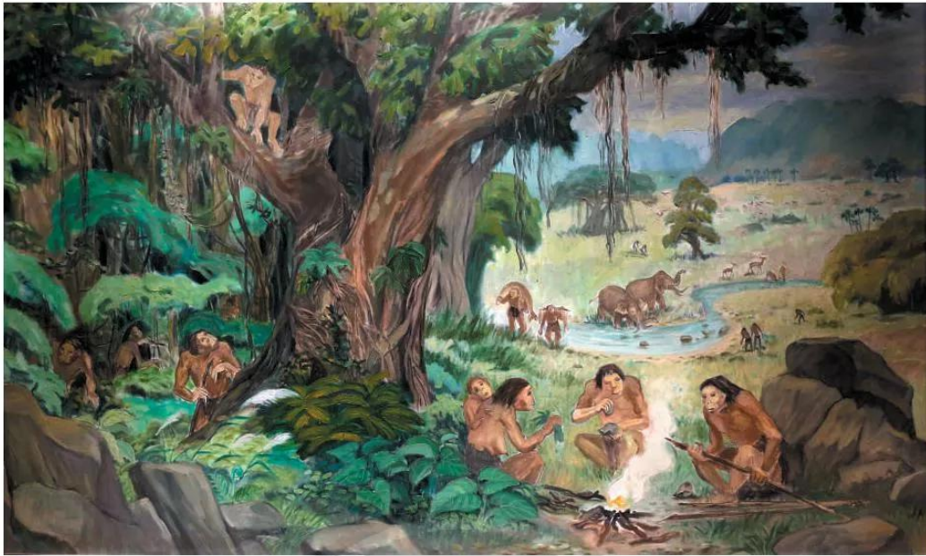
4.8 Tranh vẽ mô phỏng cuộc sống của người nguyên thủy ở Việt Nam

Qua hái lượm, người nguyên thủy phát hiện những hạt ngũ cốc, những loại rau quả có thể trồng được. Từ săn bắt, họ dần phát hiện những con vật có thể thuần dưỡng và chăn nuôi.