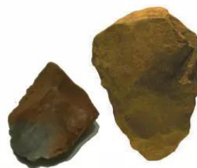
4.5 Rìu tay và mảnh tước núi Đọ (Thanh Hoá), khoảng 400 000 năm tuổi