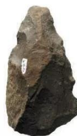
4.2 Rìu tay Tan-da-ni-a (Tanzania) châu Phi, 1,4 triệu năm tuổi

Người tối cổ cũng đã biết tạo ra lửa để sưởi ấm và nướng thức ăn.