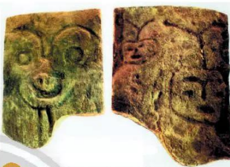
4.11 Hình khắc trong hang Đồng Nội (Hoà Bình, Việt Nam)

Em hãy quan sát hình 4.11 và cho biết người nguyên thủy đã khắc hình gì trong hang Đồng Nội?