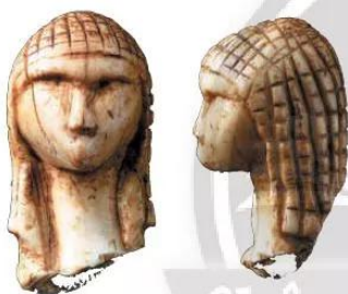
4.10 Chân dung cô gái được chạm khắc bằng ngà voi, 26 000 năm tuổi, phát hiện ở Tây Nam nước Pháp ngày nay.