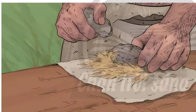
4.3 Tranh vẽ mô phỏng cách làm ra lửa

Ban đầu, người nguyên thủy chỉ biết sử dụng những mẫu đá vừa vụn cầm tay làm công cụ, dần dần họ đã biết ghè một mặt hay hai mặt của hòn đá, tạo nên những công cụ lao động thô sơ. Các nhà khảo cổ học gọi đó là những chiếc rìu tay, mảnh tước.