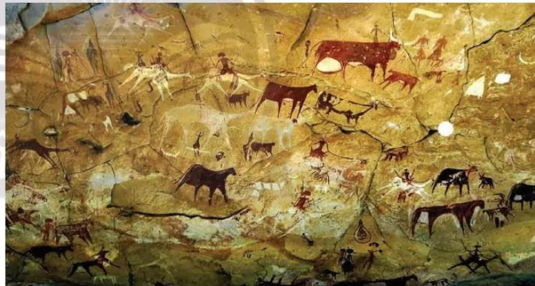
4.9 Hình vẽ trên vách hang đá ở sa mạc Xa-ha-ra (Sahara), cách ngày nay khoảng 10 000 năm

Cùng với sự phát triển của công cụ đá mài, trồng trọt, chăn nuôi và thuần dưỡng động vật, người nguyên thủy đã bắt đầu đời sống định cư.