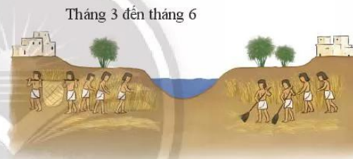
6.2 Việc gieo trồng lúa mì của người Ai Cập cổ đại phụ thuộc vào lũ trên sông Nin.

Từ tháng 3, cư dân bắt đầu thu hoạch và tích trữ lúa mì, đảm bảo nguồn lương thực.