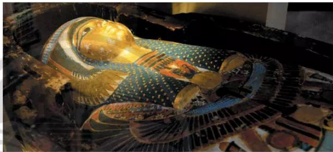
6.9 Xác ướp được tìm thấy ở The-bơ, 945 TCN – 716 TCN