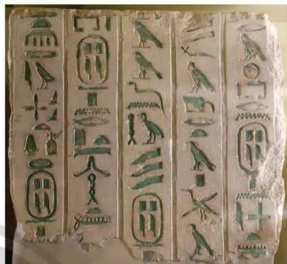
6.5 Bảng đá khắc chữ tượng hình, niên đại 2332 TCN – 2287 TCN

Người Ai Cập cổ đại dùng hình vẽ để biểu đạt ý niệm, suy nghĩ, về sau cải tiến theo hướng đơn giản hoá, chỉ lấy một phần điển hình của sự vật để tạo nên chữ. Họ khắc chữ tượng hình trên những phiến đá, sau nhờ có giấy làm từ cây pa-pi-rút (một loại cây sậy mọc ven bờ sông Nin), họ đã lưu trữ được lượng lớn thông tin.