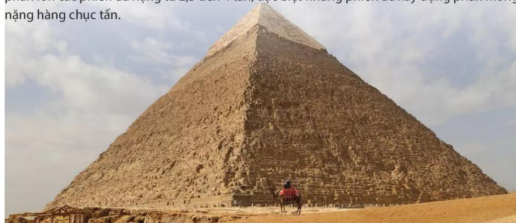
6.6 Kim tự tháp Kê-ốp (Ai Cập)

Công trình kiến trúc nổi tiếng nhất của Ai Cập là các kim tự tháp, tập trung nhiều nhất ở Mem-phít (Memphits), nơi có kim tự tháp Kê-ốp (Cheops), Thung lũng các vị Vua và khu đền tháp của vua Ram-sét II (Ramset II) thuộc phía nam Ai Cập ngày nay. Kim tự tháp Kê-ốp, một kì quan của thế giới cổ đại, có chiều cao khoảng 147 m, được tạo nên từ hơn 2 triệu phiến đá, phần lớn các phiến đá nặng từ 2,5 đến 4 tấn, đặc biệt những phiến đá xây dựng phần móng nặng hàng chục tấn.