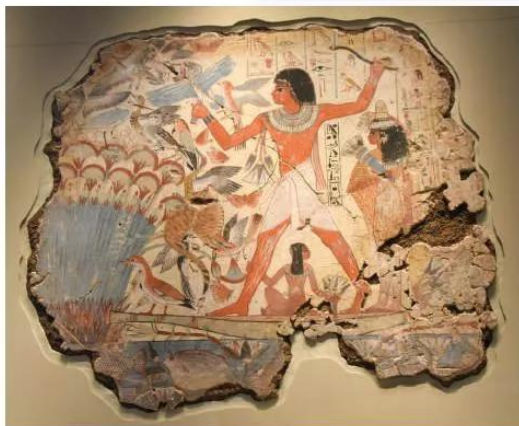
6.3 Tranh tường lăng mộ Nê-ba-mun (Nebamun), The-bơ (Thebes), 1350 TCN. Thuyền đi săn xuôi theo dòng sông Nin, hai bờ là những bụi cây pa-pi-rút (papyrus).

Sông Nin còn là tuyến đường giao thông chủ yếu giữa các vùng. Dựa vào hướng chảy xuôi dòng từ nam đến bắc của sông, người Ai Cập di chuyển và vận chuyển nguyên liệu, hàng hoá từ Thượng Ai Cập xuống Hạ Ai Cập. Khi di chuyển ngược dòng nước, họ tận dụng sức gió thổi từ biển vào, đẩy thuyền buồm đi từ Hạ Ai Cập về Thượng Ai Cập dễ dàng hơn.