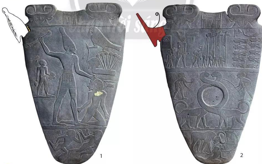
6.4 Phiến đá Na-mơ, 64 cm x 42 cm, khắc tên vua Na-mơ, Thượng Ai Cập

Năm 30 TCN, người La Mã xâm chiếm Ai Cập, nhà nước Ai Cập cổ đại sụp đổ.