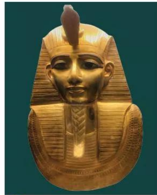
6.8 Mặt nạ vua Tu-tan-kha-mun, 1323 TCN