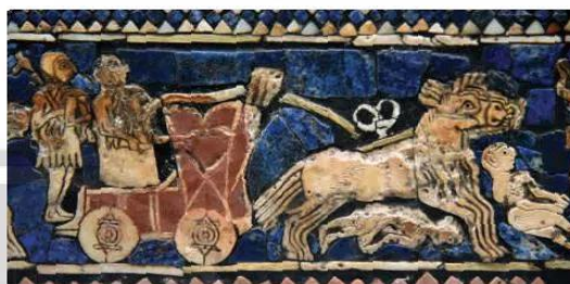
7.6 Một mặt của hộp gỗ thành Ua, 2500 tuổi Kiệt tác nghệ thuật Lưỡng Hà cổ đại, khắc hoạ cảnh chiến tranh.

Công trình kiến trúc nổi tiếng của Lưỡng Hà cổ đại là vườn treo Ba-bi-lon, xây dựng vào thế kỉ VI TCN. Nhà sử học Hy Lạp cổ đại Hê-rô-đốt đã mô tả vườn treo nhìn từ xa trông giống như một quả đồi xanh tươi đầy hoa, hương thơm ngào ngạt toả khắp thành Ba-bi-lon.