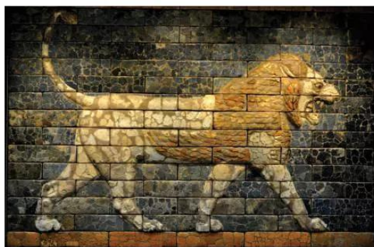
7.5 Sư tử găm – gạch men, cung điện vua Ba-bi-lon, thế kỉ VI TCN