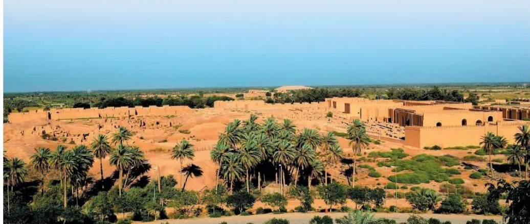
7.1 Toàn cảnh di tích thành cổ Ba-bi-lon (Babylon) của Lưỡng Hà cổ đại, I-rắc (Iraq)

Lưỡng Hà là vùng đất nằm trên lưu vực hai con sông Ơ-phơ-rát (Euphrates) và Ti-gơ-rơ (Tigris), người Hy Lạp cổ đại gọi là Mê-dô-pô-ta-mi (Mesopotamia), có nghĩa là “vùng đất giữa hai con sông” (Lưỡng Hà). Đó là một vùng bình nguyên rộng lớn, bằng phẳng, nhận phù sa hằng năm khi nước lũ dâng lên từ sông Ơ-phơ-rát và Ti-gơ-rơ. Ở đây, người ta biết làm nông nghiệp từ rất sớm. Họ trồng chà là, ngũ cốc, rau củ và thuần dưỡng động vật.