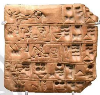
7.3 Bảng chữ hình nêm của người Lưỡng Hà, 2400 năm TCN

Thành tựu văn học nổi bật của người Lưỡng Hà là bộ sử thi Gin-ga-mét (Gilgames), nói về người anh hùng huyền thoại của Lưỡng Hà, được xây dựng dựa trên hình tượng một vị vua có thật của người Xu-me.