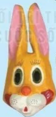
Mặt nạ