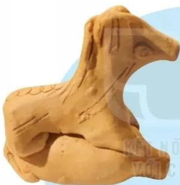
Tò he đất nung