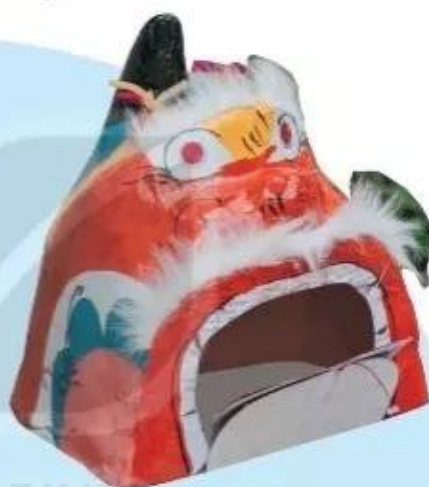
Đầu sư tử