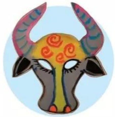
Mặt nạ đầu trâu , sản phẩm mỹ thuật từ vật liệu tái sử dụng, Huy Hiếu