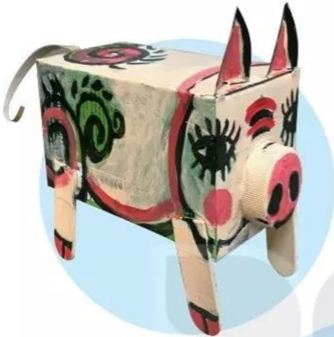
Con lợn , sản phẩm mỹ thuật từ vật liệu tái sử dụng, Lan Linh