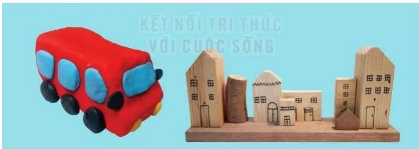
Ô tô buýt, sản phẩm mỹ thuật từ đất nặn, Hà Phương