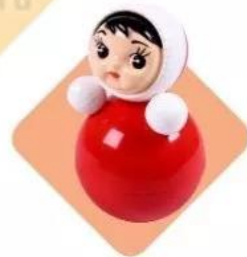
Búp bê lật đật