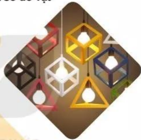
Đèn trang trí