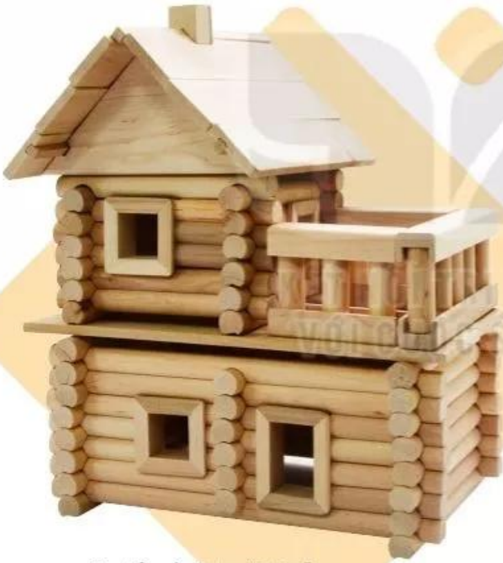
Sản phẩm xếp hình ngôi nhà gỗ

Sự kết hợp của các khối trong một số đồ vật