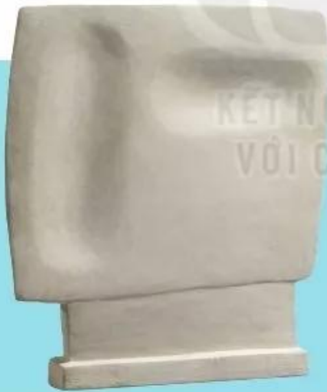
Cái đầu, tượng đá, An-béc-tô Gia-cô-mét-ti (Alberto Giacometti), 1928