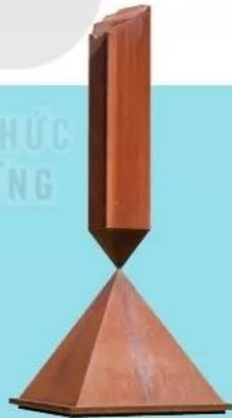
Tháp đối nhau, tượng thép, Ba-nét Niu-men (Barnett Newman), 1963 – 1967