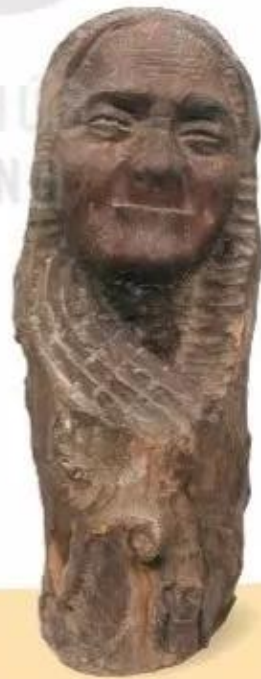
Bà má miền Nam, tượng gỗ, Trần Tía