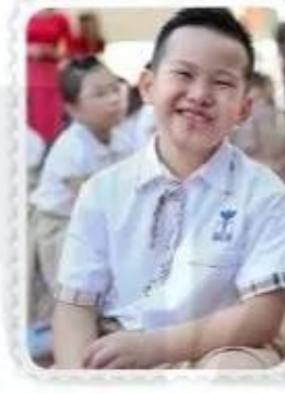
Bạn ở trường