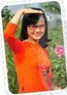
Cô của em