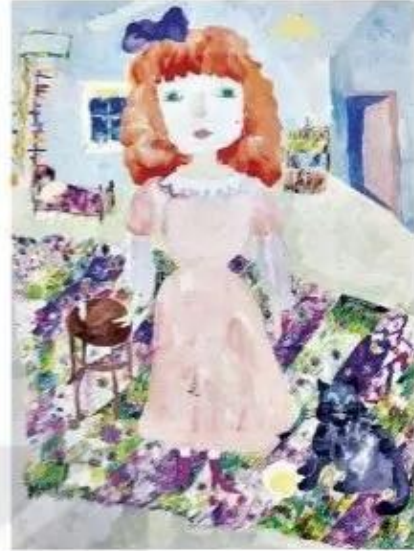
Mẹ tôi và con mèo, sản phẩm mỹ thuật từ màu nước, I-sa-y-ê-va A-li-na (Isayeva Alina)