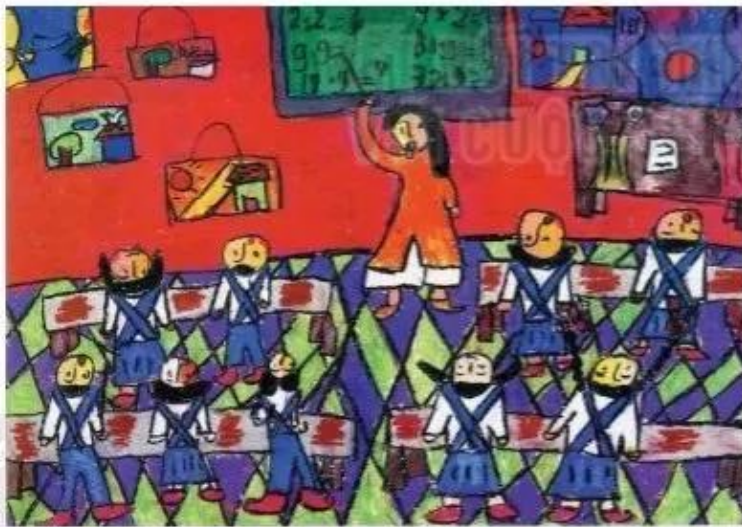
Lớp học, sản phẩm mĩ thuật từ sấp màu, Trịnh Trần Trần