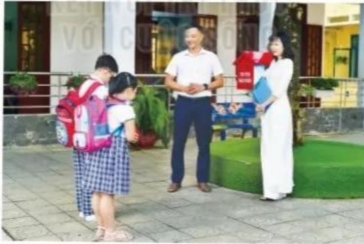
Chào thầy cô