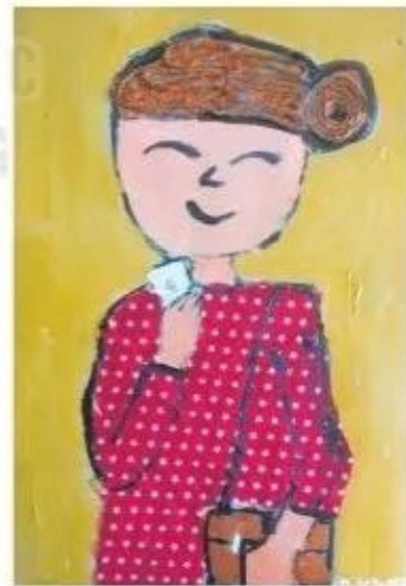
Cô giáo em, sản phẩm mĩ thuật đa chất liệu, Phúc Khang