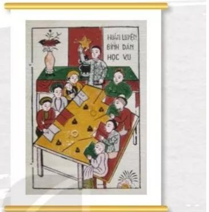
Binh dân học vụ, tranh dân gian Đông Hồ