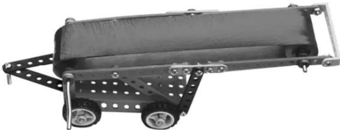
Hình 4. Băng chuyển