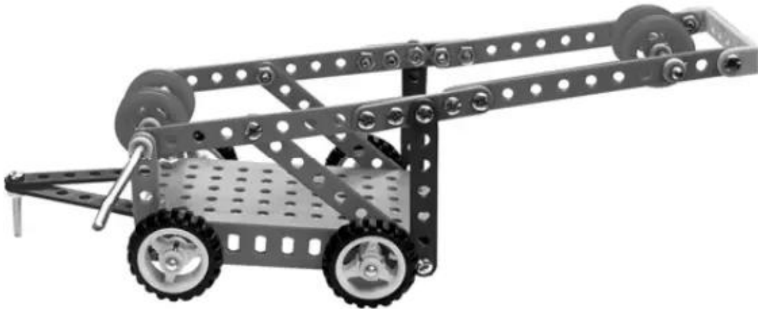
Hình 3. Giá đỡ băng chuyển