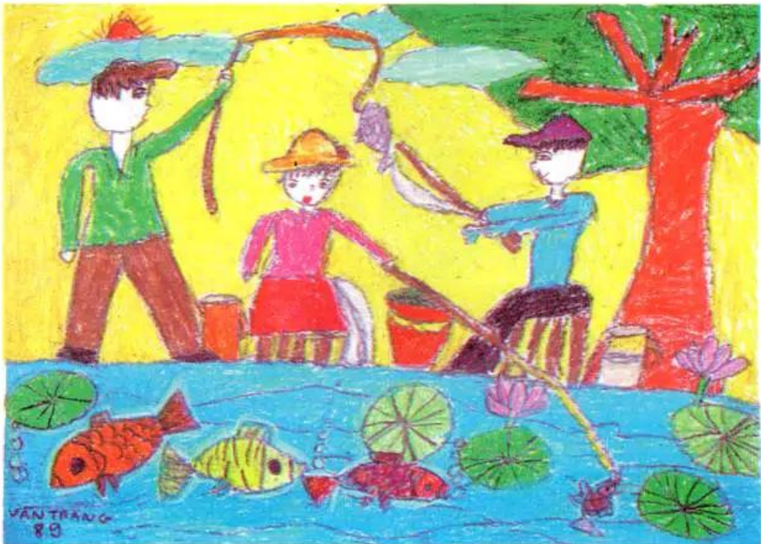
Câu cá. Tranh sáp màu và bút dạ của Vân Trang

Đây là những hoạt động có thể tìm, chọn để vẽ tranh.