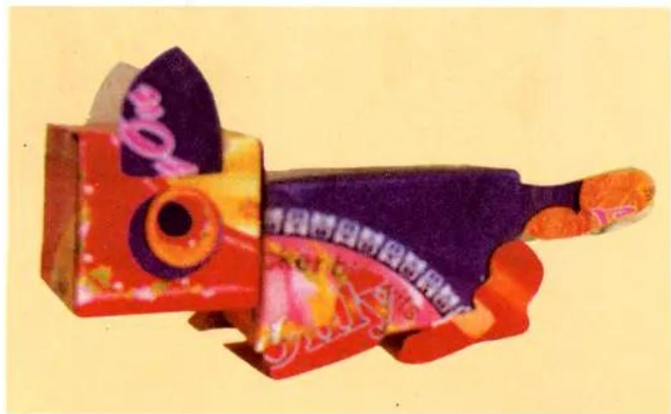
Hình 1. Tạo dáng con mèo, ô tô bằng vỏ hộp (Hình tham khảo)