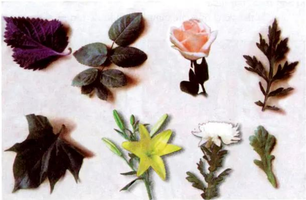
Hình 1. Hoa, lá (Ảnh)

– Lá cây có nhiều loại, nhiều hình dáng khác nhau : có loại lá to, lá nhỏ ; có loại lá đơn, lá kép,... Màu sắc của lá thay đổi phụ thuộc vào từng thời điểm khác nhau (lá non, lá già).