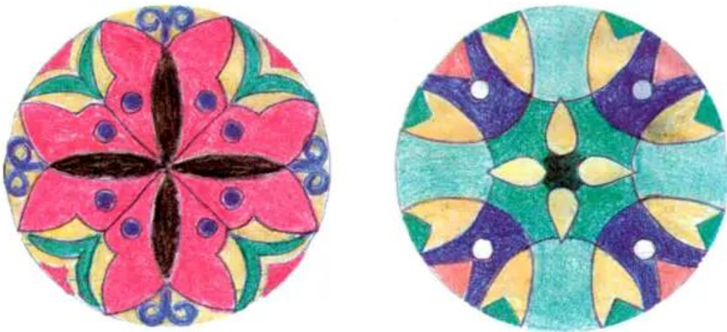
Hình 2. Trang trí hình tròn (Tham khảo)