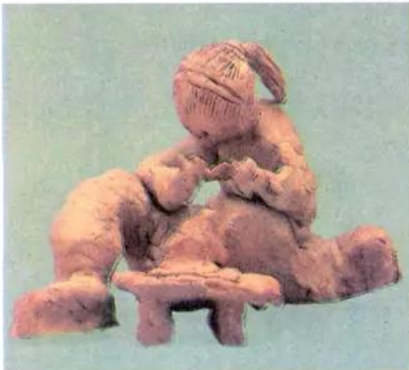
Nhà điêu khắc tí hon. Bài tập nặn của học sinh