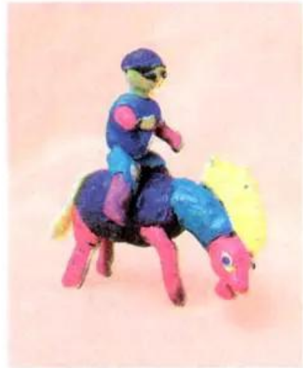
Bé cưỡi ngựa. Bài tập nặn của học sinh