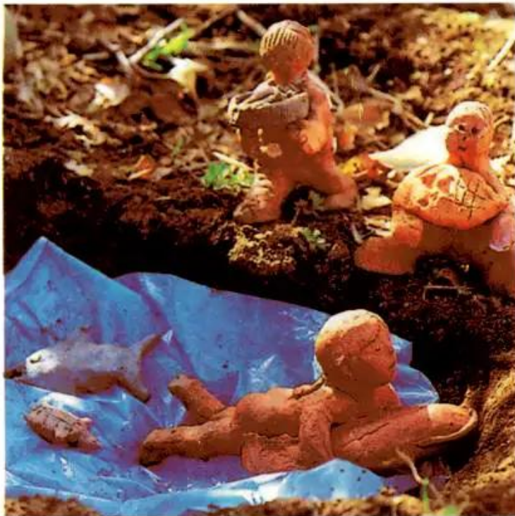
Bắt cá. Bài tập nặn của học sinh