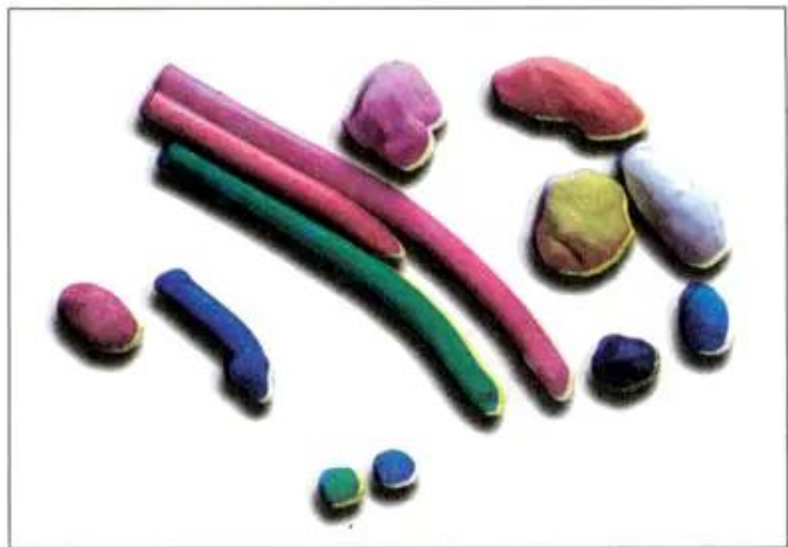
Hình 1. Đất nặn