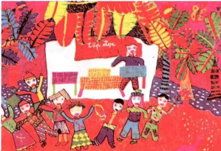
Trường em. Tranh màu bột của học sinh