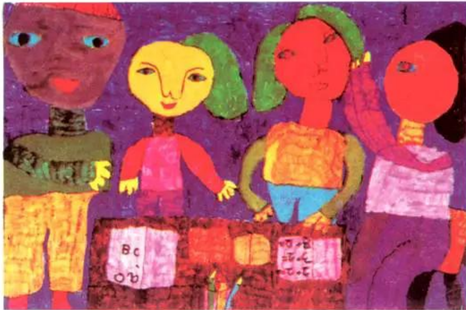
Trong lớp. Tranh bút dạ của học sinh