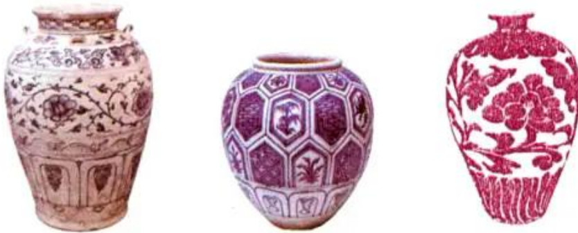
Hình 1. Một số lọ hoa có trang trí