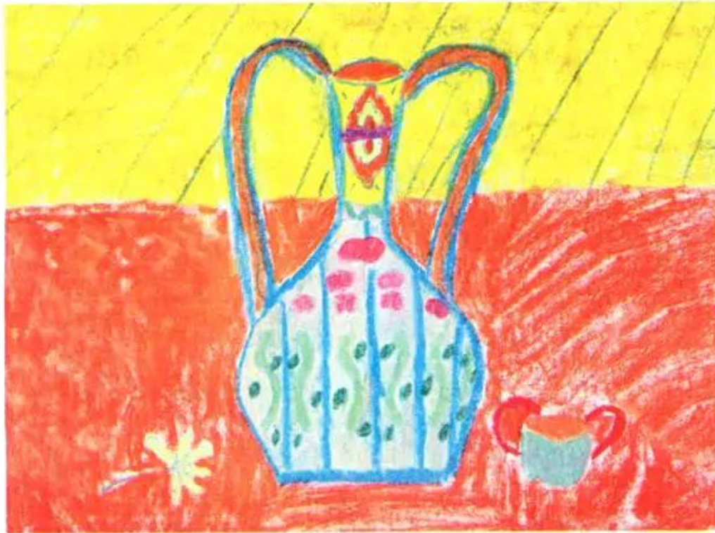
Một số bài trang trí lọ hoa của học sinh