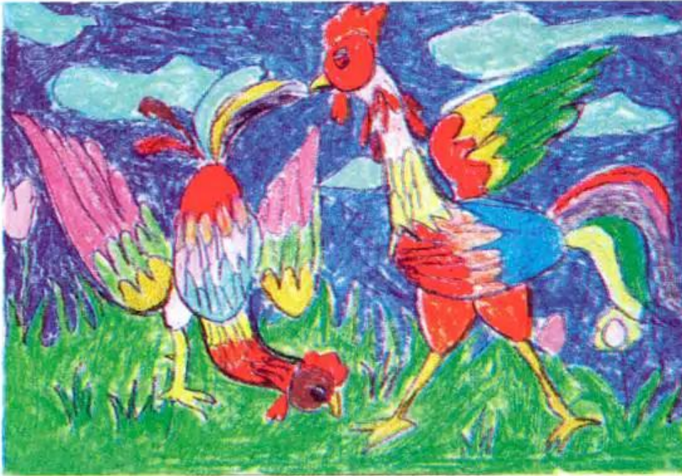
Gà trống. Tranh sếp màu của học sinh