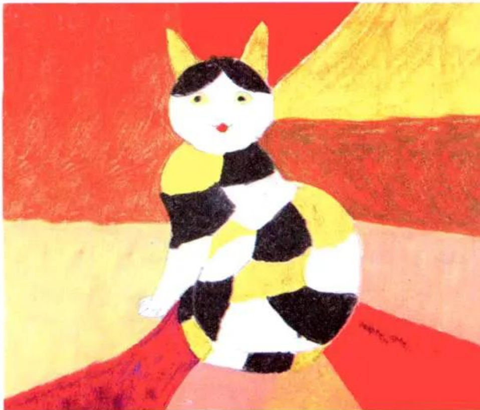
Mèo. Tranh màu bột của học sinh