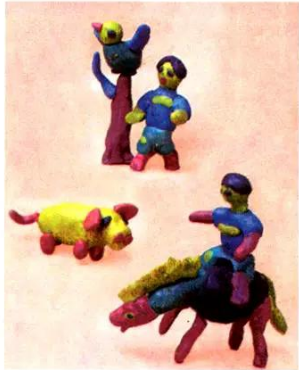
Hình 1. Một số hình nặn của học sinh

Nhớ lại những hình ảnh và các động tác để nặn.