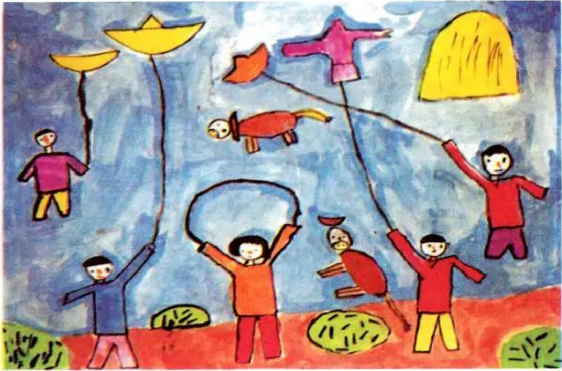
Mùa hè vui. Tranh màu nước của học sinh