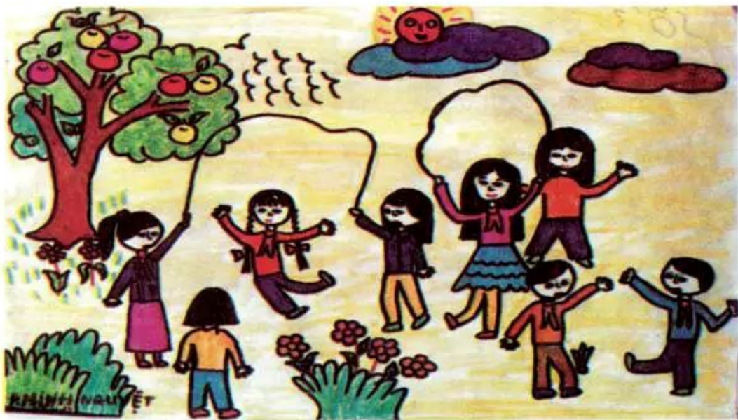
Nhảy dây. Tranh sếp màu của học sinh