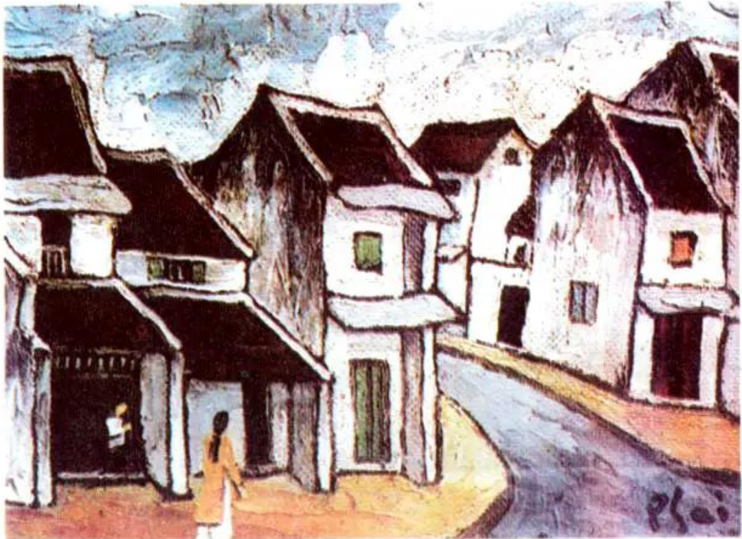
Phố cổ. Tranh sơn dầu của họa sĩ Bùi Xuân Phái

b) Phố cổ. Tranh sơn dầu của họa sĩ Bùi Xuân Phái (1920 - 1988)