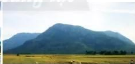
Núi Cẩm (An Giang) cao 705 m.