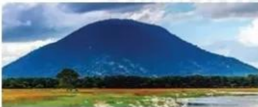
Núi Bà Đen (Tây Ninh) cao 986 m.