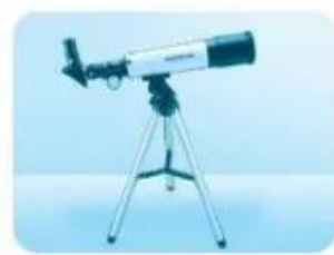
.....ính thiên văn