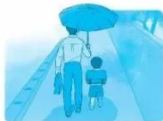
.....e nắng .....o con