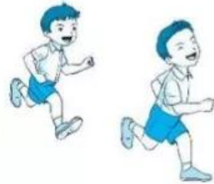
chơi đ... bắt