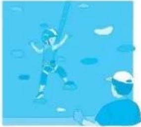
leo n... nhân tạo