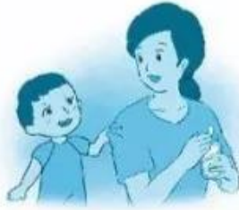
n... áo mẹ