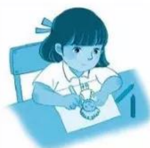
tô m.....búp bê tóc xoắn