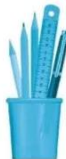
hộp .....ấm bút