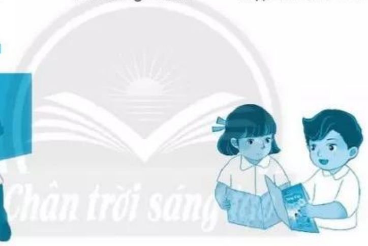
mở sách gi.....khoa