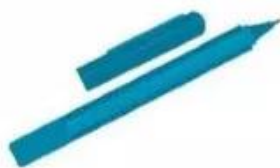
bút lông .....im