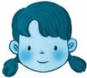
làn da trắng treo