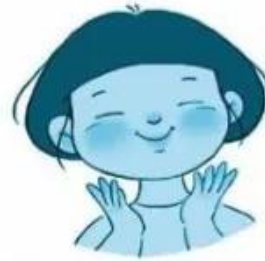
khuôn mặt bầu binh