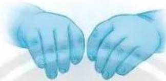
bàn tay mồm mim