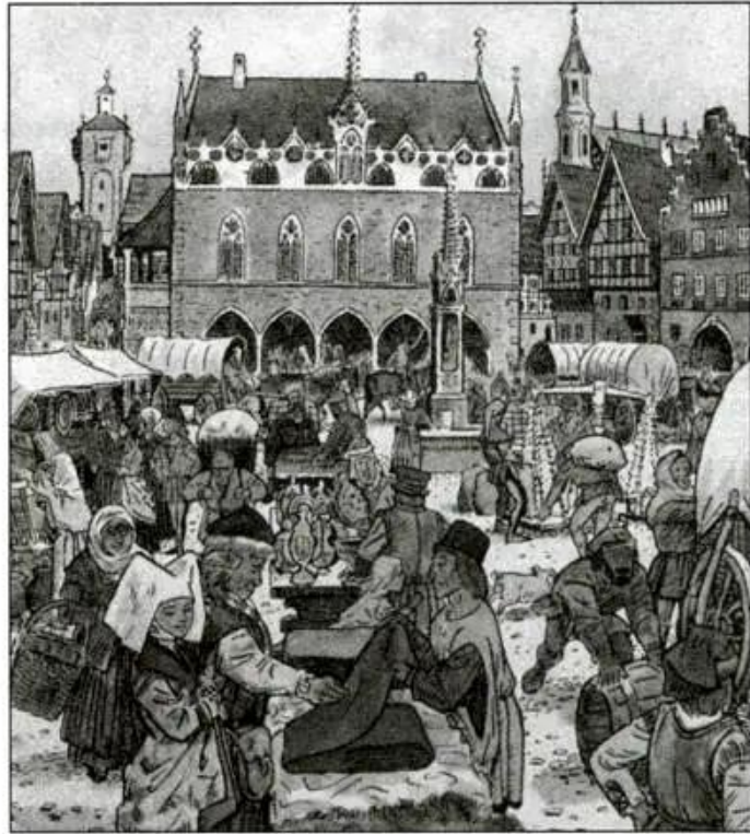
Hình 2 - Hội chợ ở Đức (tranh vẽ)

Như thế, trong thành thị, cư dân chủ yếu là những thợ thủ công và thương nhân. Họ lập ra các phường hội, thương hội để cùng nhau sản xuất và buôn bán. Hằng năm, họ còn tổ chức những hội chợ lớn để triển lãm, trao đổi và buôn bán sản phẩm. Do vậy, sự ra đời của thành thị trung đại có một vai trò rất quan trọng đối với sự phát triển của xã hội phong kiến ở châu Âu.