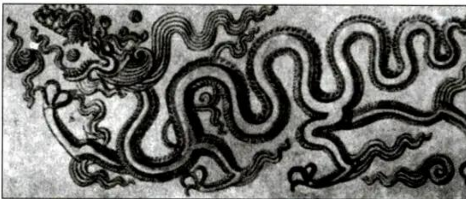
Hình 26 - Hình rồng thời Lý

Phong cách nghệ thuật đa dạng, độc đáo và linh hoạt của nhân dân ta thời Lý đã đánh dấu sự ra đời của một nền văn hoá riêng biệt của dân tộc - văn hoá Thăng Long .