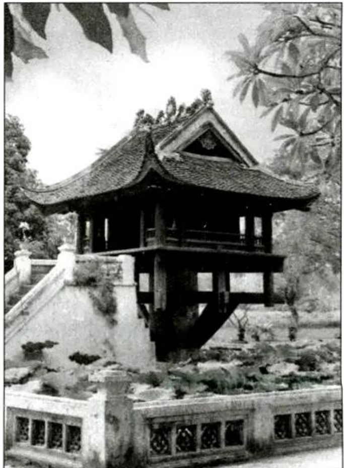
Hình 25 - Chùa Một Cột (Hà Nội)

Trong Hoàng thành có những toà nhà cao 4 tầng. Tháp Báo Thiên ở Thăng Long gồm 12 tầng. Chùa Một Cột được xây dựng trên một cột đá lớn, dựng giữa hồ, tượng trưng cho một bông sen nở trên mặt nước.