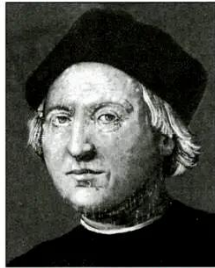
Hình 4 - C. Cô-lôm-bô (1451 - 1506)

Những cuộc phát kiến địa lí đã góp phần thúc đẩy thương nghiệp châu Âu phát triển và đem lại cho giai cấp tư sản châu Âu những nguồn nguyên liệu quý giá, những kho vàng bạc, châu báu khổng lồ cùng những vùng đất mênh mông ở châu Á, châu Phi và châu Mĩ.