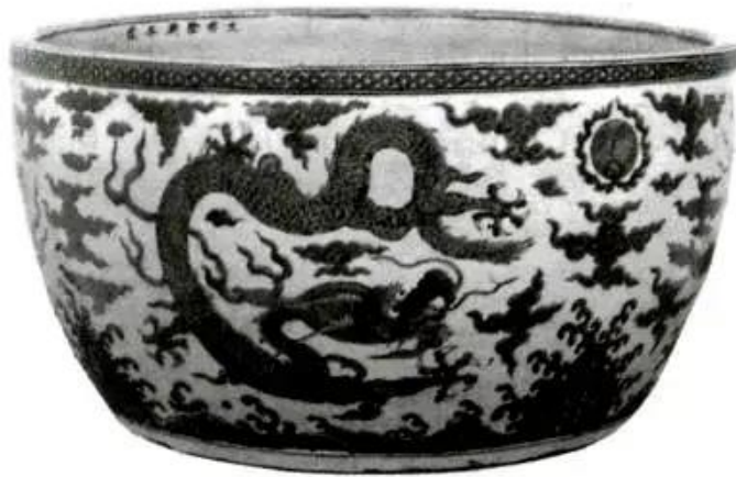
Hình 10 - Liễn men trắng xanh thời Minh