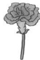
Hoa phăng 6 000 đồng