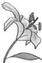
Hoa ly 15 000 đồng