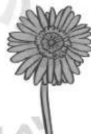
Hoa đồng tiền 5 300 đồng