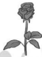
Hoa hồng 4 500 đồng