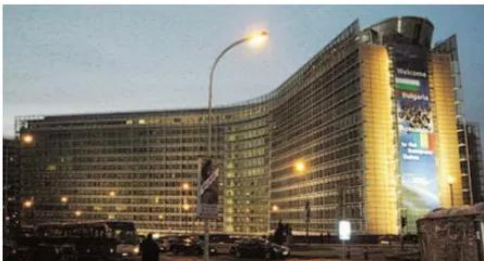
Hình 9.1. Trụ sở EU ở Brúc-xen (Bỉ)

Năm 1967, Cộng đồng châu Âu (EC) được thành lập trên cơ sở hợp nhất ba tổ chức nói trên. Với hiệp ước Ma-xtrich, năm 1993 Cộng đồng châu Âu đổi tên thành Liên minh châu Âu (EU).