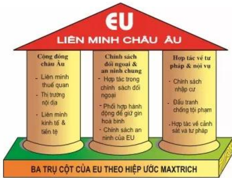
Hình 9.3. Ba trụ cột của EU theo hiệp ước Ma-xtrích (1993)