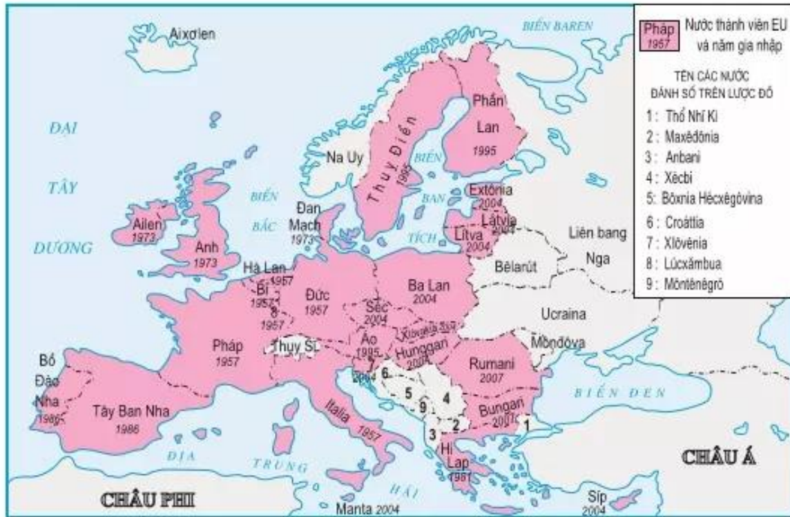
Hình 9.2. Liên minh châu Âu năm 2007

EU ngày càng mở rộng về số lượng thành viên và phạm vi lãnh thổ. Từ 6 nước thành viên ban đầu năm 1957, đến đầu năm 2007 EU đã có 27 thành viên (EU 27).