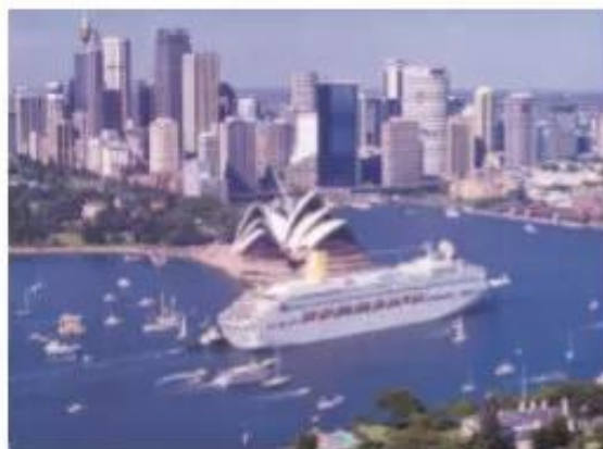
Hình 15.2. Thành phố cảng Xít-ni

Thương mại có vai trò quan trọng. Mạng lưới các ngân hàng, các chi nhánh tài chính ngày càng mở rộng, thương mại điện tử rất phát triển.