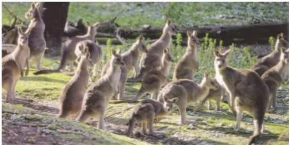
Hình 15.1. Căng-gu-ru - Động vật đặc trưng ở Ô-xtrây-li-a

Ô-xtrây-li-a là quốc gia giàu có về khoáng sản như than, sắt, kim cương, dầu khí, chì, thiếc, đồng, mangan, uranium,... và là nơi sinh sống của nhiều loài động, thực vật bản địa quý hiếm. Chính phủ Ô-xtrây-li-a rất quan tâm đến bảo vệ môi trường. Hơn 5% diện tích đất đai được dành để bảo tồn thiên nhiên, trong đó có 11 khu di sản thế giới, 500 công viên quốc gia.