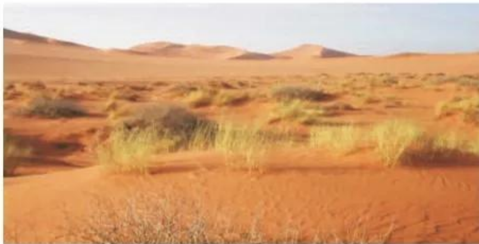
Hình 6.2. Hoang mạc Xa-ha-ra

Khoáng sản và rừng là những tài nguyên đang bị khai thác mạnh. Rừng bị khai phá quá mức để lấy gỗ, chất đốt và mở rộng diện tích canh tác làm cho đất đai của nhiều khu vực bị hoang hoá, nhất là ven các hoang mạc, bán hoang mạc. Việc khai thác khoáng sản nhằm mang lại lợi nhuận cao cho nhiều công ti tư bản nước ngoài đã làm cho nguồn tài nguyên này bị cạn kiệt và môi trường bị tàn phá.