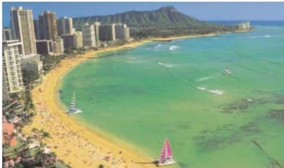
Hình 7.2. Ha-oai - điểm du lịch nổi tiếng của Hoa Kỳ

Ha-oai là quần đảo nằm giữa Thái Bình Dương có tiềm năng rất lớn về hải sản và du lịch.