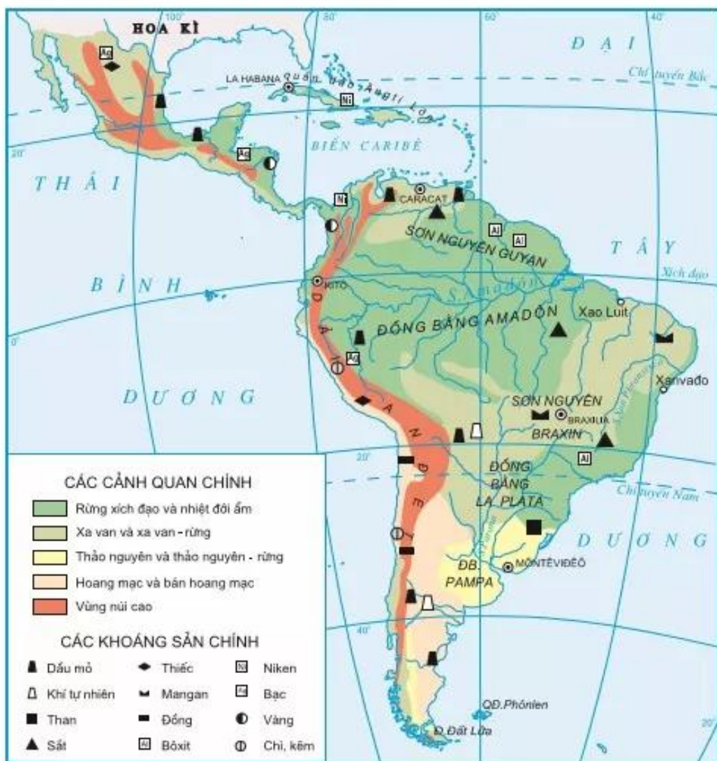
Hình 6.3. Các cảnh quan và khoáng sản chính của Mĩ La tinh