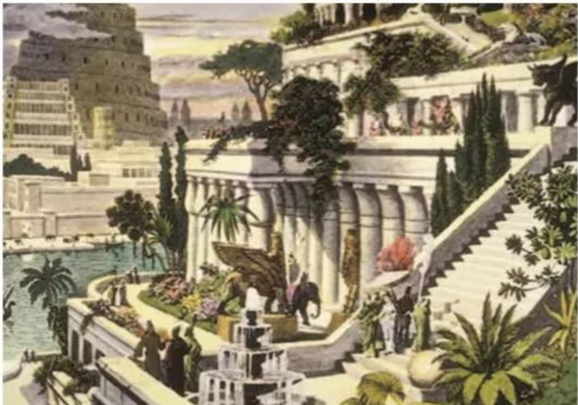
Hình 6.6. Vườn treo Ba-bi-lon - (tranh vẽ)

Là tôn giáo có ảnh hưởng sâu, rộng trong khu vực nhưng hiện nay đạo Hồi bị chia rẽ bởi nhiều giáo phái khác nhau. Những phần tử cực đoan của các tôn giáo, giáo phái đang góp phần gây ra sự mất ổn định trong khu vực.