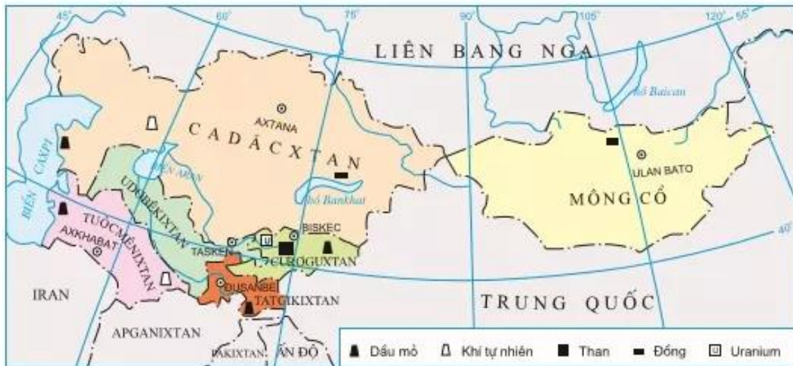
Hình 6.7. Khu vực Trung Á

Quan sát hình 6.7, hãy cho biết Trung Á có những quốc gia nào? Vị trí địa lý, lãnh thổ của khu vực có đặc điểm gì?