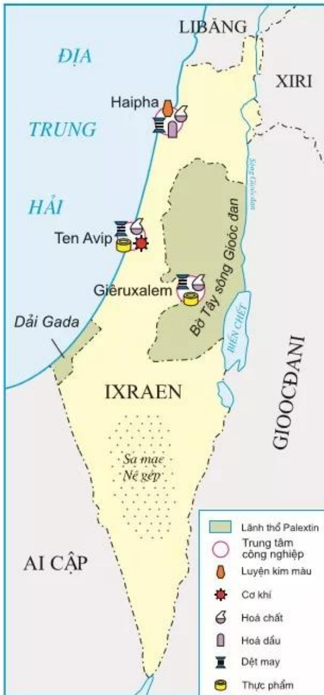
Hình 6.8. I-xra-en và Pa-le-xtin (năm 2006)

Nhà nước I-xra-en được thành lập năm 1948 (theo Nghị quyết số 181 của Đại Hội đồng Liên hợp quốc khoá 2 năm 1947) với diện tích 14 100km 2 . Hiện nay I-xra-en có diện tích là 21059km 2 gấp 1,5 lần so với năm 1948, bao gồm vùng đồng bằng hẹp ven Địa Trung Hải, vùng núi Giu-đa ở trung tâm, một phần thung lũng Gioóc-đan ở đông bắc và sa mạc Nê-gép ở phía nam.