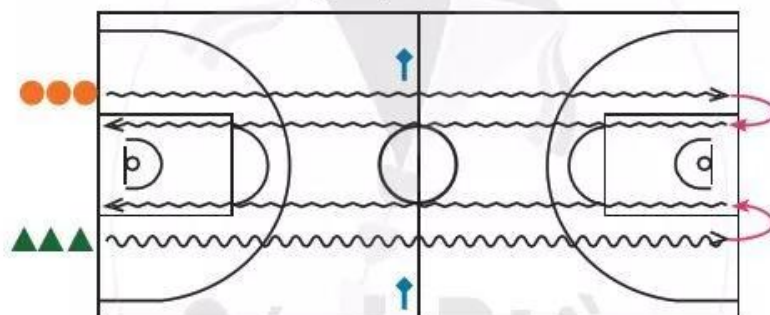
Hình 5. Sơ đồ trò chơi "Dẫn bóng tiếp sức"

Cách chơi: Các thành viên của mỗi đội lần lượt dẫn bóng tốc độ tới đường biên cuối sân bên đối diện và quay về chuyền bóng cho người tiếp theo. Đội nào hoàn thành trước sẽ thắng cuộc.