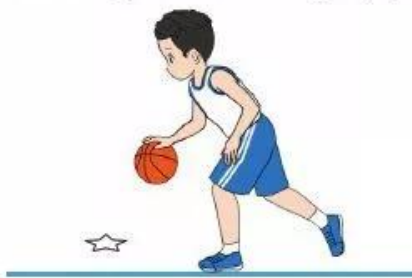
Hình 3. Di chuyển trên đường kẻ thẳng dẫn bóng

Các bài tập trên có thể tập luyện cá nhân, theo cặp hoặc theo nhóm.