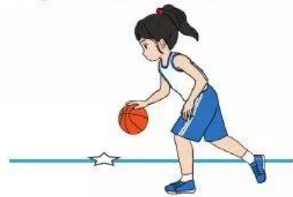
Hình 4. Di chuyển dẫn bóng tiếp xúc vào đường kẻ thẳng