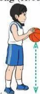
(b) Hai tay cùng tiếp xúc bóng liên tục dẫn bóng