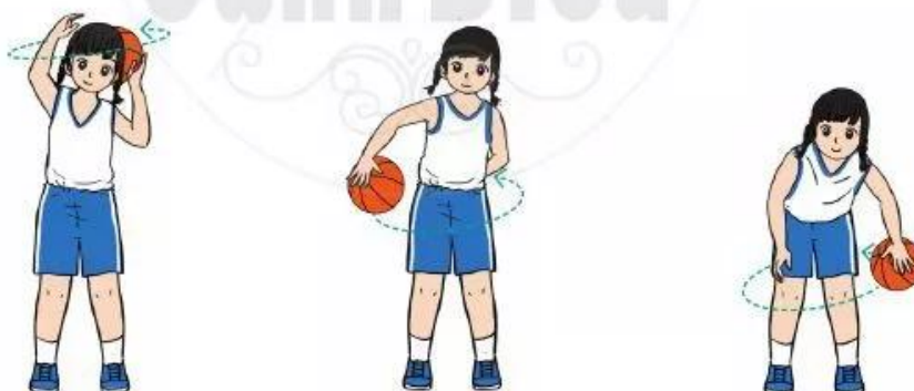
Hình 1. Chuyển bóng qua hai tay