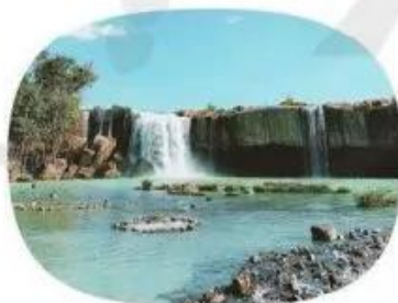
Vườn quốc gia Chư Mom Ray