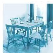
9. Bàn ăn