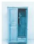
3. Tủ quần áo