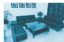
10. Bàn ghế sofa