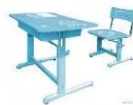
5. Bàn ghế học sinh