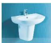
7. Chậu rửa mặt