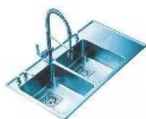
6. Chậu rửa bát