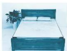
1. Giường ngủ

Câu 4. Hãy sử dụng các đồ vật dưới đây để sắp xếp vào các phòng sao cho phù hợp với một gia đình có bố mẹ và hai người con.