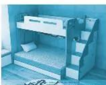
2. Giường tầng