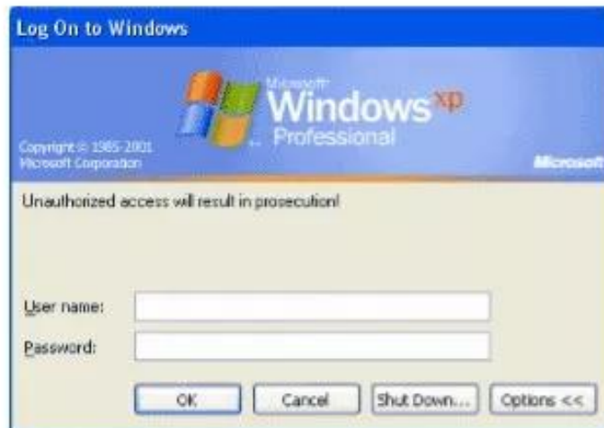
Hình 34. Màn hình đăng nhập