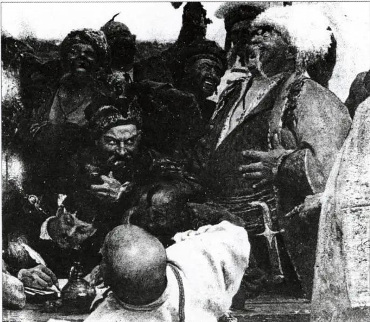
Gia-pô-rô-giơ viết thư cho vua Thổ Nhĩ Kỳ. Trích đoạn tranh sơn dầu của Rê-pin

Trạng thái tình cảm thường được thể hiện trên nét mặt : khi vui, buồn, tức giận ; lúc đắm chiêu suy nghĩ hay thờ ơ, lạnh nhạt,... Vì vậy, chỉ nhìn vào nét mặt mỗi người, ta cũng có thể biết được tâm trạng của họ lúc đó như thế nào.