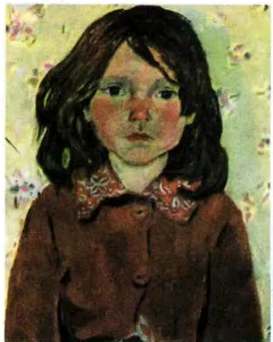
Nhìn-ca Tranh của họa sĩ người Nga