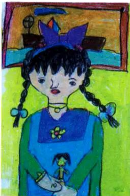
Chân dung Tranh sếp màu của học sinh