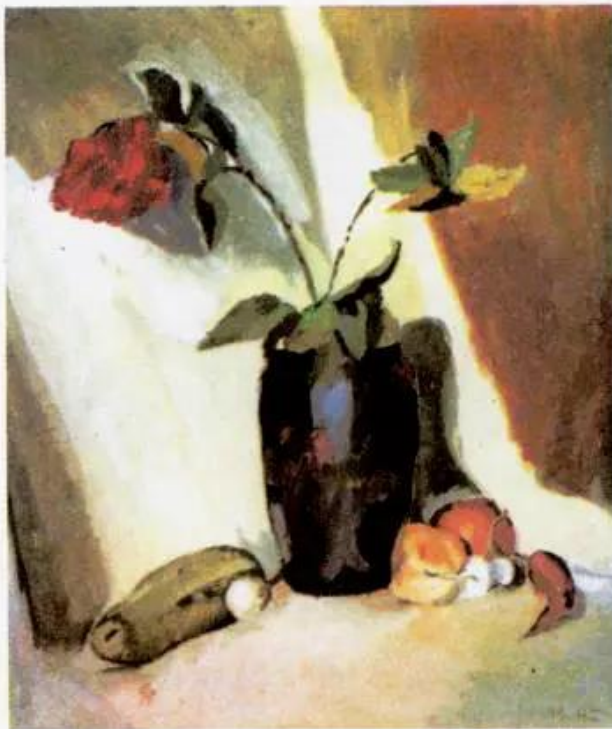
Hoa quả quê hương Tranh màu bột của Lê Minh Hà