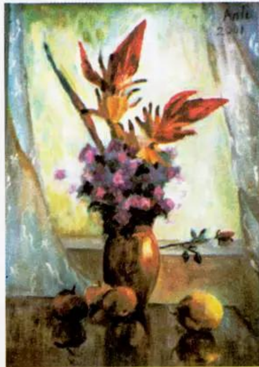
Tĩnh vật Tranh màu bột của Thục Anh