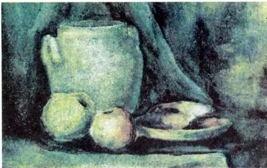
Tĩnh vật (tham khảo)