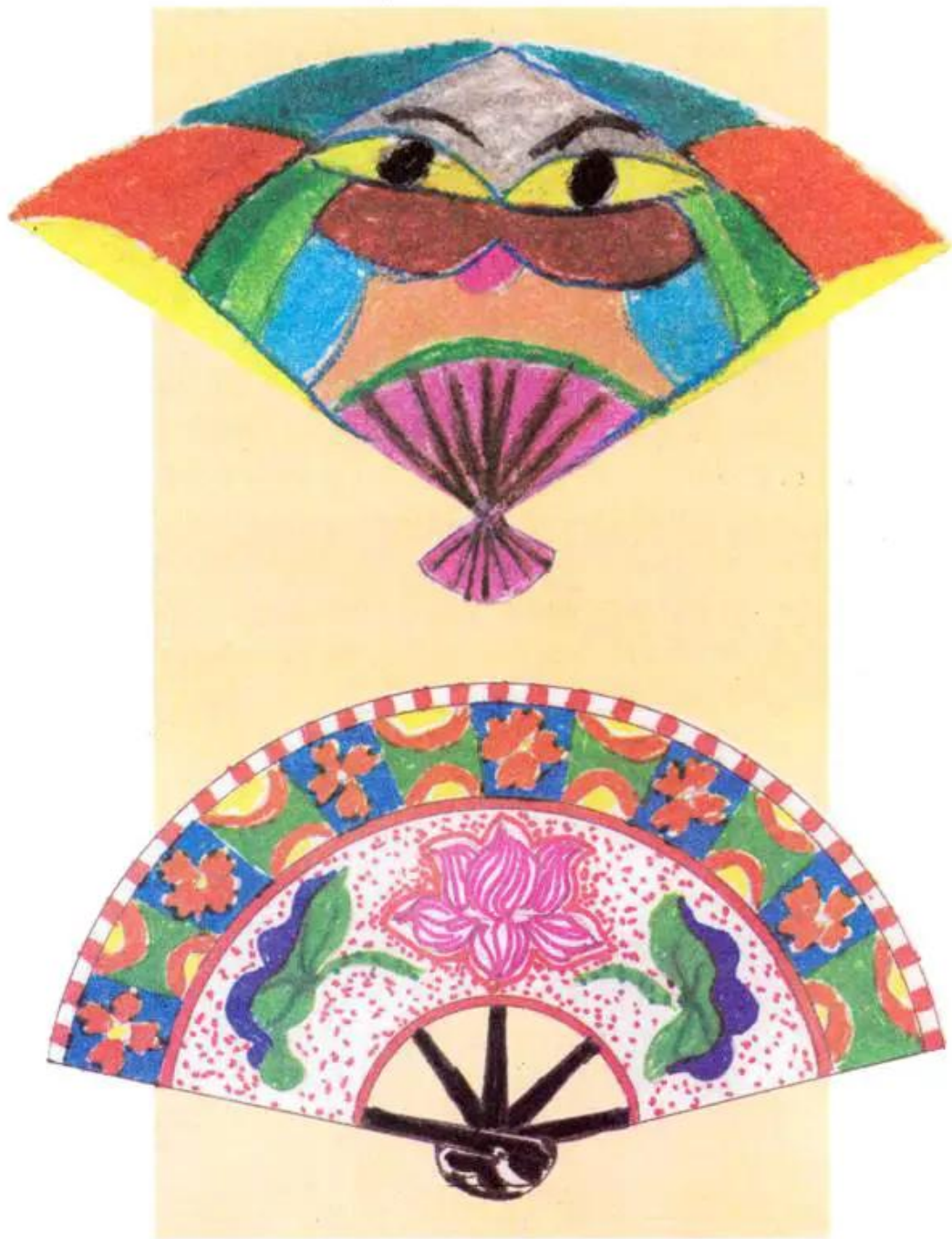
Hình 4. Bài vẽ của học sinh