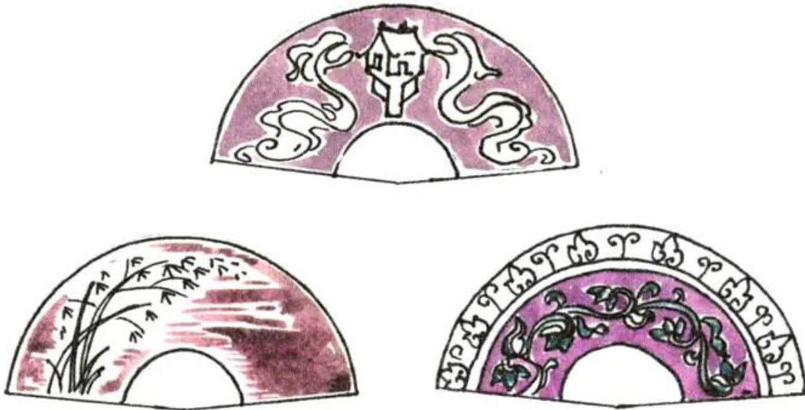
Hình 3. Một số cách trang trí quạt giấy