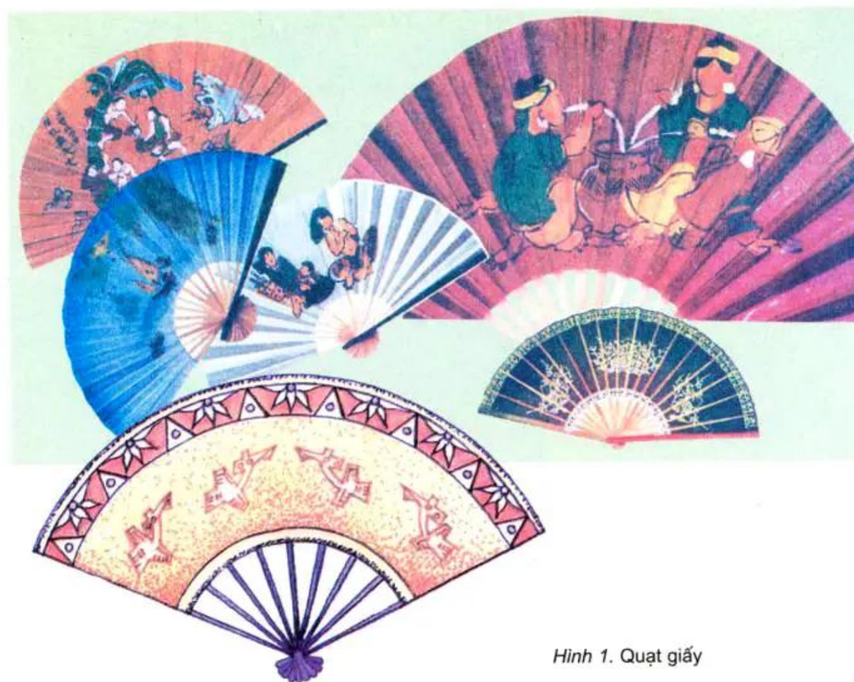
Hình 1. Quạt giấy